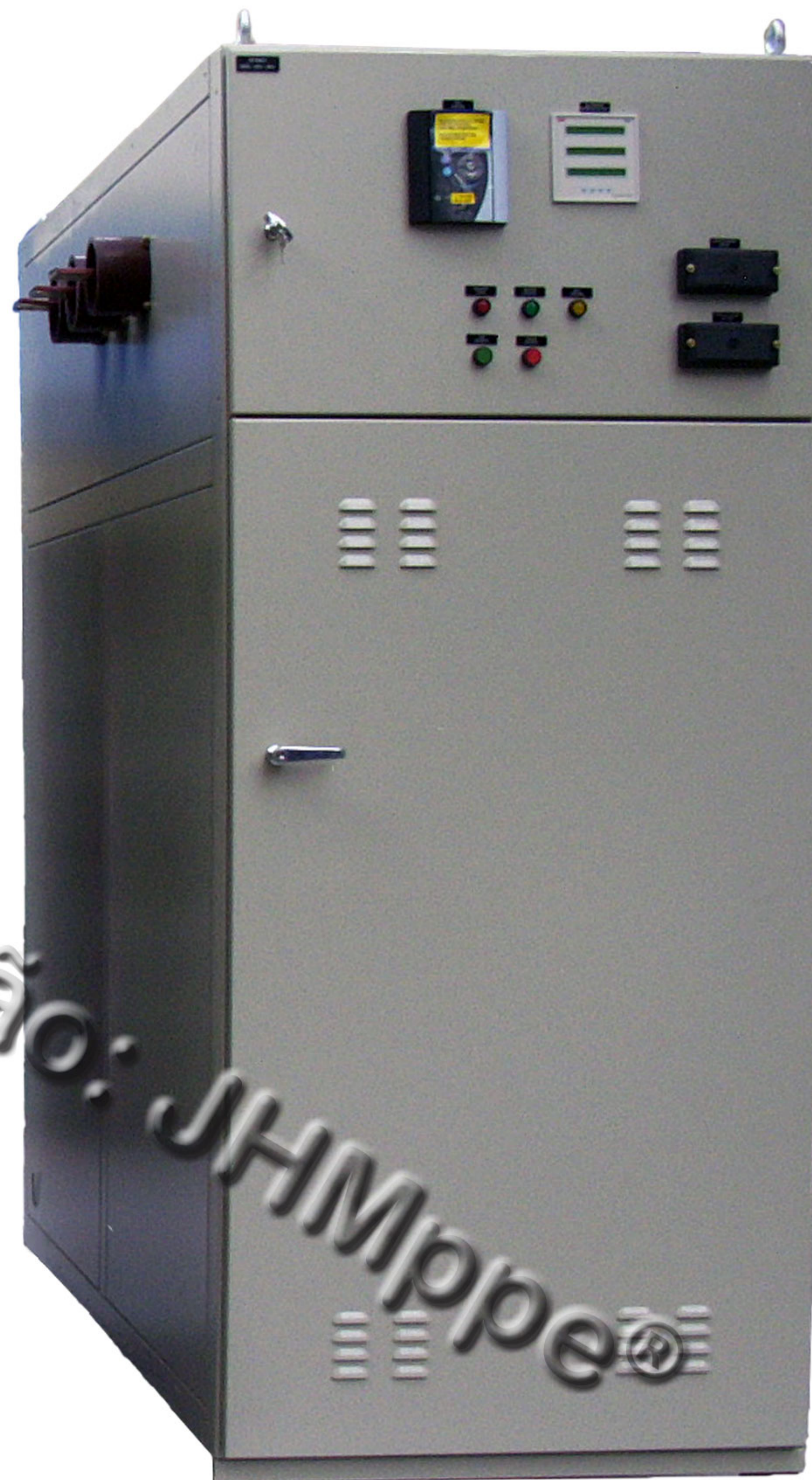
Vista frontal c/porta externa

Cliente Final: Central de Alcool Lucélia Ltda. Metal enclosed